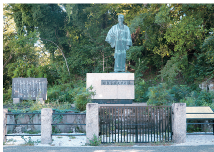
陸奥宗光伯の銅像

組む。また、銅像のメンテナンスについては、管理方法を調査研究し、適切に保存できるよう努める。