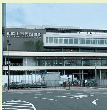
12月開館予定の新市民図書館

議案第17号、和歌山市民図書館条例等の一部を改正する条例の制定について。これは、新市民図書館が今年12月に開館するに当たり、所要の改正を行うものです。