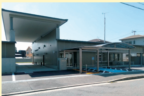
和歌山市動物愛護管理センター

び感染症の患者に対する医療に関する法律による入院患者の自己負担額の認定基準において、認定の基礎が所得税法規定の所得税額から地方税法規定の所得割の額に改正されたため、所要の改正を行うものです。