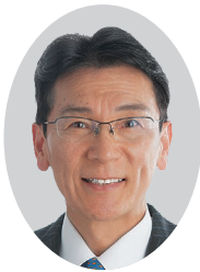
そのうち ひろき 園内 浩樹