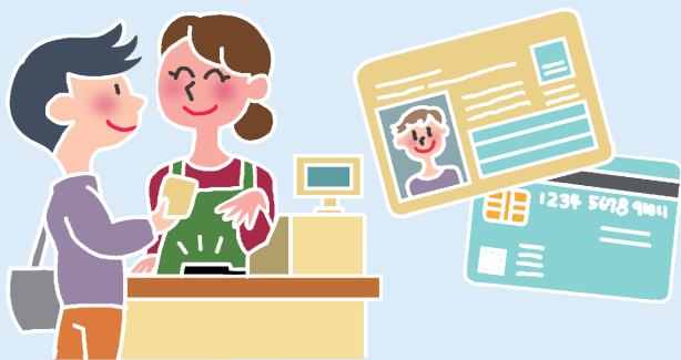
自治体プレミアムポイント利用イメージ

なお、審査過程において、市民図書館の跡地活用(専門職大学の設置)について、執行部から報告があり、これに対し、各委員から意見指摘及び要望がありました。