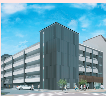
(仮称)市営北駐車場外観イメージ

議案第25号、町の新設について。これは、和歌山市和歌山大学前駅周辺土地区画整理事業の換地処分に合わせて、字の区域・名称を変更するため、地方自治法第260条第1項の規定に基づき議会の議決を得るものです。