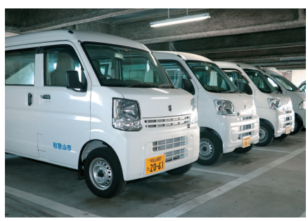
和歌山市の公用車

の徹底や、各課の一部の車両を総務局の集中管理に組み入れるなどして、適正な台数の把握と効率的な運用ができるよう努めていく。