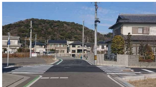
② 既設市道西脇19号線から北向き