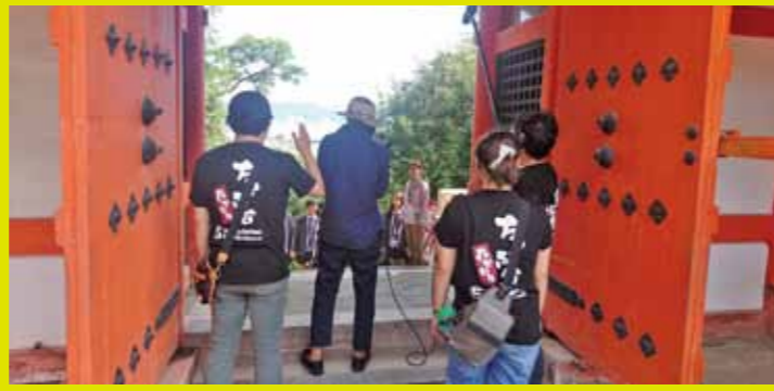
▲紀州東照宮 紀州徳川家初代・頼信(よりのぶ)公が父・家康公の霊を祀るために造営。煩惱を表す108段の階段を登りつめると朱塗り極彩色の楼門が迎えてくれます。