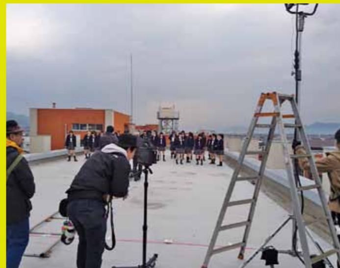
▲登美丘高校ダンス部

〒640-8511 和歌山市七番丁23番地 TEL: 073-435-1234 FAX: 073-435-1263 Email: kanko@city.wakayama.lg.jp