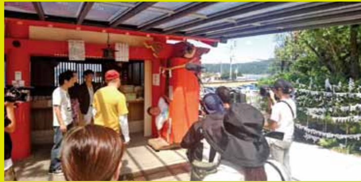
▲淡嶋神社 紀文の帆柱(きぶんのほぼしら) 願い事を唱えながら、この柱の穴をくぐり抜けると、願い事が叶うと言われています。