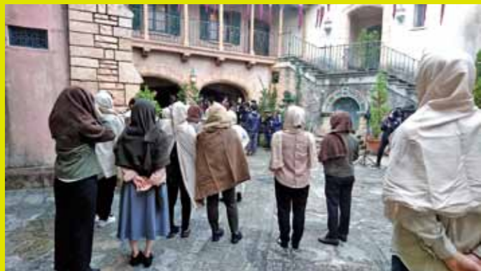
▲和歌山マリーナシティ「ポルトヨーロッパ」

ポルトヨーロッパは、ヨーロッパの街並を本格的に再現したテーマパークで市内ロケ地の定番となっています。