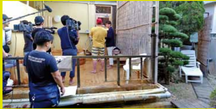
▲花山温泉 薬師の湯 一度入ると忘れられない!茶褐色の炭酸温泉が特徴で観光客や地元の方で賑わっています。