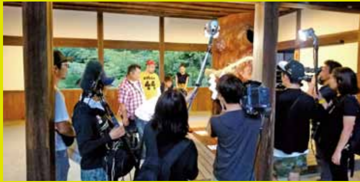
▲伊太祁曾神社 厄難除け木の俣くぐり。くぐると厄除けになると言われています。