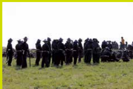
▲参加されたエキストラの皆さん 早朝からの撮影で大変そうです。合戦のシーンをカッコ良く演出してくれました。