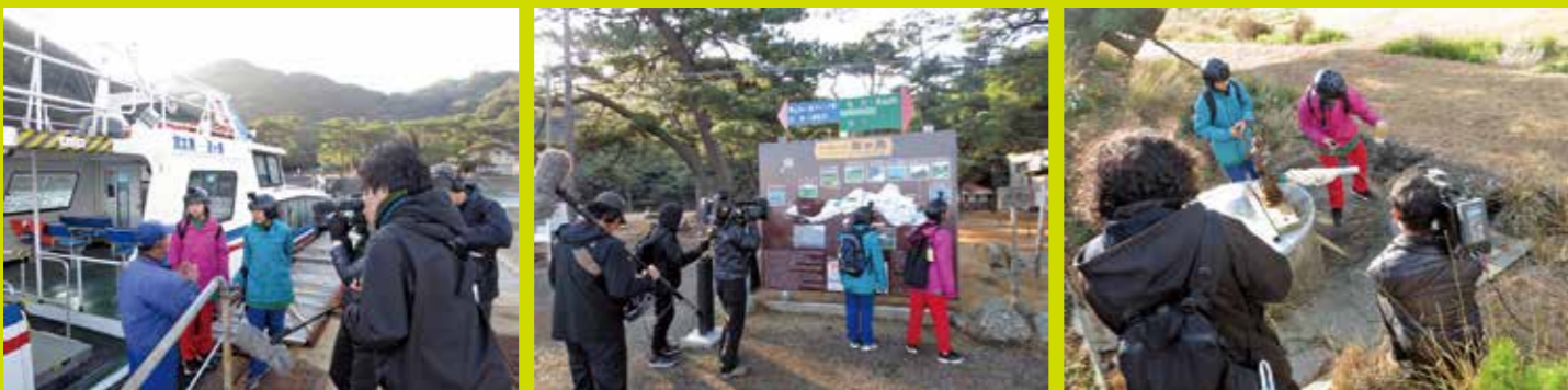
▲友ヶ島での撮影の様子。番組では、野奈浦広場やキャンプやレクリエーションに最適な南垂水キャンプ場などがシーンに登場しました。