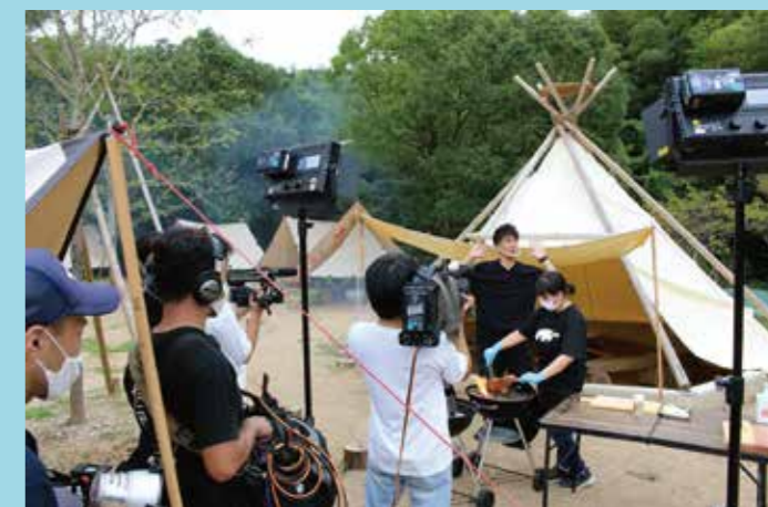
▲FOOD HUNTER PARK (炎の囲炉裏)