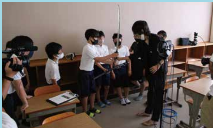
▲加太中学校 見学の子供達に小道具を渡す空下監督