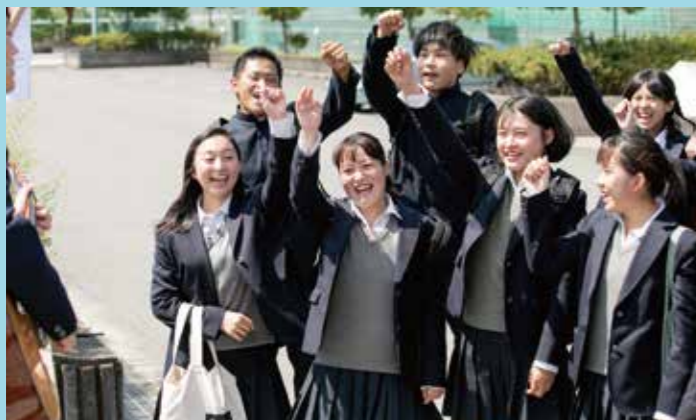
▲和歌山市立和歌山高等学校 総勢30名の生徒さん達がエキストラとして撮影に参加しました!