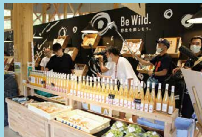
▲FOOD HUNTER PARK (水の市場)