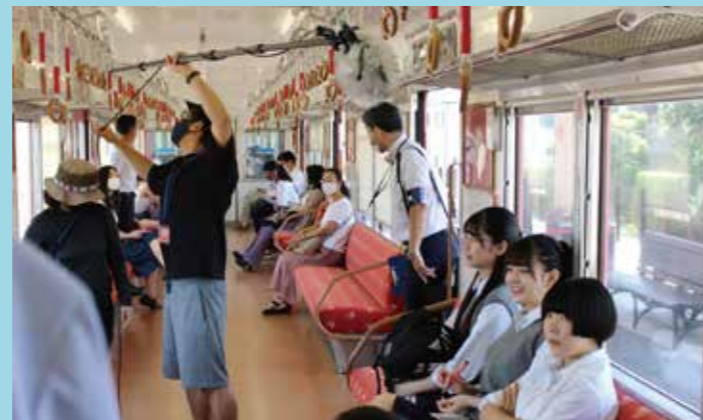
▲南海電鉄加太線 電車が実際に運行するなかで、撮影に臨みました。