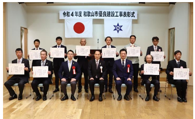
優良建設工事技術者

※表彰工事は、令和3年度(令和3年4月1日から令和4年3月31日まで)に完成した工事の中から和歌山市優良建設工事表彰要綱に基づき決定しています。