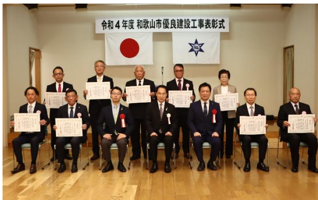
優良建設工事業者