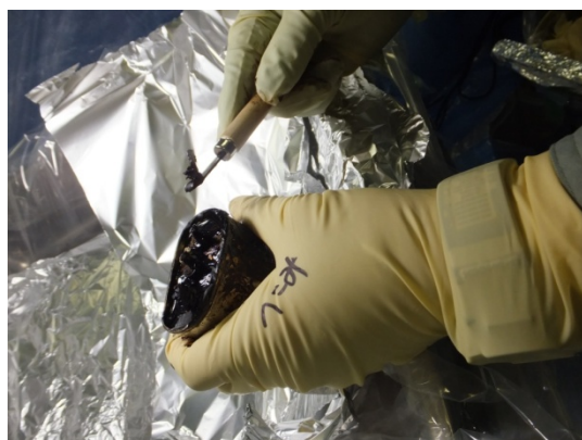
剥き身コンデンサ付着充填材の採取