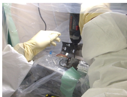
コンデンサ外付け型廃安定器充填材の採取