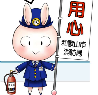
和歌山市消防局 マスコットキャラクター

今後も、消防法令違反のある建物の関係者に対して、継続して改善指導を行ってまいります。