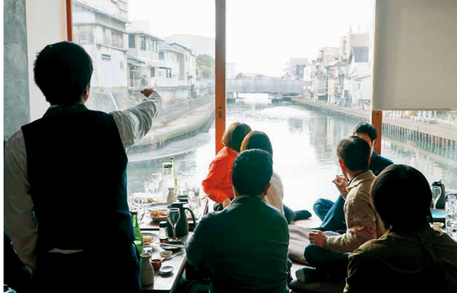
(写真) 本文中のイベント「立春の日に、和歌山の水で醸されたその日搾りたての地酒を飲みながら、和歌山の水辺について考えるシンポジウム」の様子