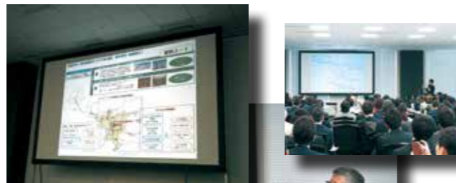
(写真) 全国の都市再生推進法人の関係者が集う会議で和歌山市の取組みを紹介

市では今後も、各団体の活力を十分に発揮していただけるよう制度の整備等に努め、官民協働によるまちづくりを推進していきます。