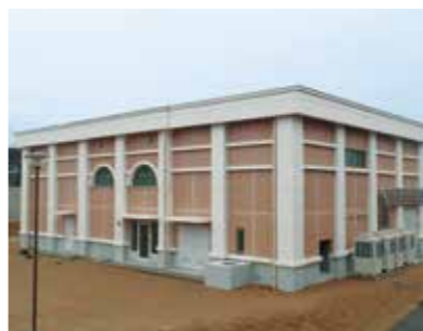
真砂配水場新設(平成31年度稼働予定)

企業局では料金収入の減少などの課題がありますが、経営の安定を図りながら、耐震構造の配水場や老朽化した浄水場の更新工事など計画的に事業に取り組み、安定給水に努めています。