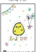
▲川口 杏果 (野崎小3)