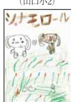
▲高橋 瑞季 (和佐小2)