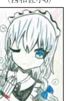
▲出村 瑠唯 (松江小6)