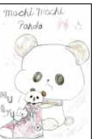
▲寺脇 生季 (松江小5)