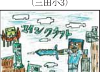
▲鈴木 悠申 (東山東小3)