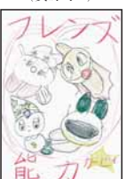
▲野田 紫月 (雑賀小5)