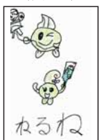
▲山根 穂香 (紀伊小3)