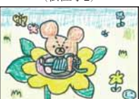
▲山本 花永 (岡崎小3)