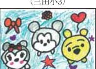
▲ささ木 めい (三田小3)