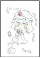
▲橋本 有紗 (安原小4)