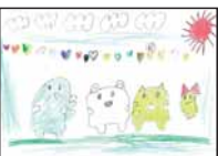
▲穴見 咲稀 (松江小2)