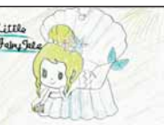
▲田中 美沙 (松江小5)