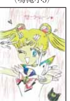
▲花本 雪乃 (浜宮小5)