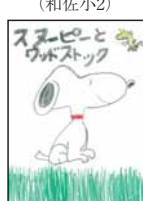
▲大矢 いぶき (太田小3)