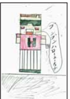
▲松尾 昂矢 (安原小4)