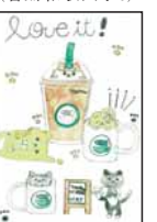
▲庄礼 有那 (西和佐小6)