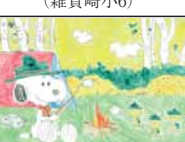
▲住澤 梨乃 (西和佐小6)