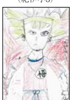
▲東出 たくま (雑賀崎小3)