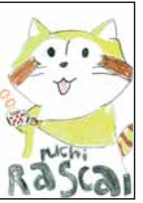
▲中島 彩 (山東小5)