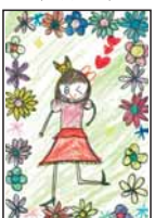
▲松阪 まゆ (野崎小3)