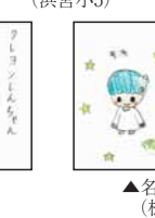
▲名倉 こゆき (松江小4)