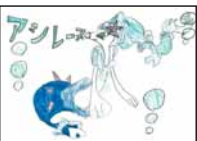
▲成川 愛珠 (智辯和歌山小2)