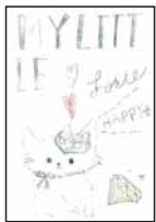
▲大江 梨杏 (紀伊小3)