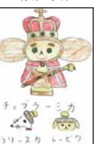
▲中川 和紀 (松江小5)