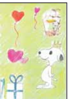
▲松尾 華連 (四箇郷北小5)