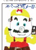
▲土山 奏空 (山口小2)