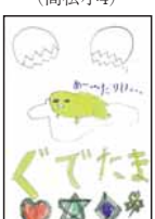
▲杉本 奈紗 (西脇小4)