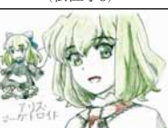
▲北原 優織 (今福小6)