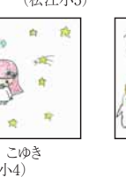
▲須方 天雅 (宮小4)