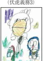
▲山崎 咲良 (和附特小3)