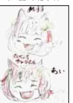
▲田中 零音 (鳴滝小5)