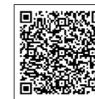
前回の開催風景はこちら