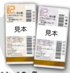
リサイクルシールの一例 シールは数種類あります