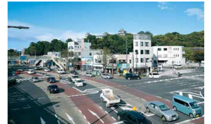
和歌山城と一体性があり、紀州徳川家により維持管理されてきました。

国の文化審議会は6月15日、史跡和歌山城に「扇の芝」と呼ばれた場所の一部を追加指定するよう、文部科学大臣に答申しました。「扇の芝」は和歌山城の南西部にあり、かつては芝地でした。また、江戸時代の「紀伊国名所図会」に当時の姿が描かれており、城外の見通しを確保するなど、城と一体性が強い土地として維持管理されてきました。