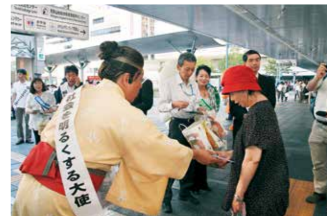
朝の通勤通学時間に合わせ、街頭啓発が行われました。