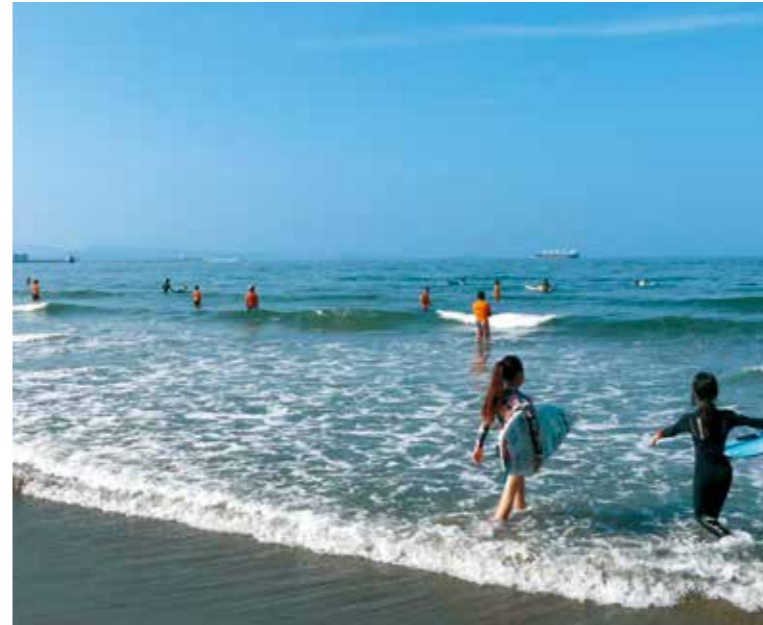
待ちに待った海開き。照りつける太陽の下、多くの家族連れらで賑わいました。

オープニングセレモニーの後、加太小学校では「地域ブランディング」をテーマに第1回地域ゼミを開催。地域ブランディングやデザイン、食に関する有識者のみなさんが、加太のブランディングにあたってのポイントなどについて語り合いました。