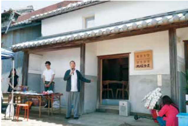
ラボは加太の古い蔵を改修して整備され、内装の一部に紀州木材が使用されました。