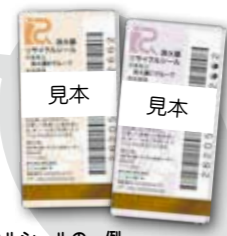
リサイクルシールの一例 シールは数種類あります