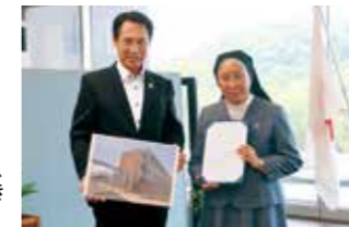
「大学・地域・行政と一緒に、新しい大学のスタートを支えていきたい」と尾花市長。