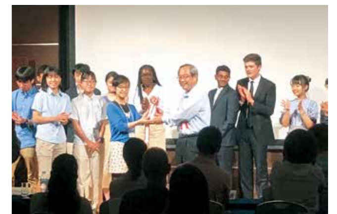
最終日にはビジネスプランコンテストが開催。優勝チームは表彰されました。

国内外の高等学校の生徒を対象に、英語でビジネスを学ぶプログラム「GTE」が和歌山市で開催されました。参加者たちは、4泊5日のワークショップで、ビジネスプランのアイデア出し、チームでの議論、プレゼンテーション発表などを行い、ビジネスと会計の基本をおさえながら、ビジネスマネジメントを英語で学びました。