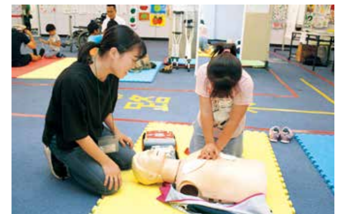
和歌山ろうさい病院職員や東京医療保健大学の学生がサポート。

ぶらくり丁の「みんなの学校」で、さまざまな仕事体験ができる「キッズ商店街 in ぶらくり丁」が開催され、8月26日には病院の仕事体験ができる「みんなのキッズ☆ホスピタル」が和歌山市で初めて開催されました。子供たちは看護師体験でAEDを使用した救命方法を学んだり、助産師体験で乳児の世話の仕方などを学んだりしていました。