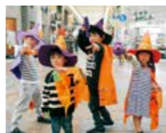
▲ハロウィン・ストリート・フェスタ (イメージ)