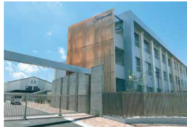
校舎は旧本町小学校の既存校舎等を改修整備されました。