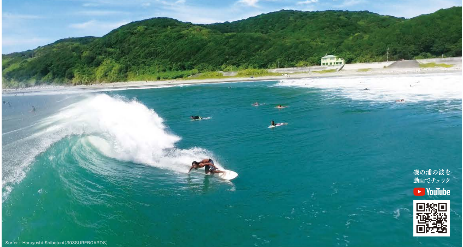
Surfer: Haruyoshi Shibutani (303SURFBOARDS)