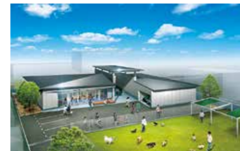
秋にオープン予定の(仮称)動物愛護センター