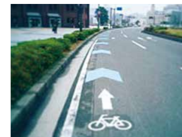
自転車専用のブルーレーン