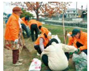
地域のまちづくり活動（清掃活動）