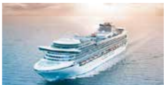
約12万トンの「ダイヤモンド・プリンセス」初の寄港