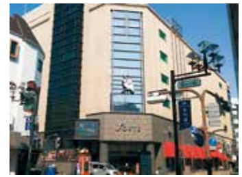
和歌山市地域フロンティアセンターが入るフォルテワジマ