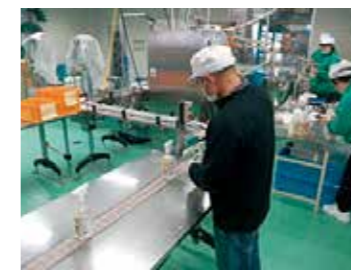
障害者の就労を支援