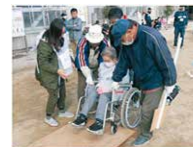
災害時要援護者の避難を想定した訓練