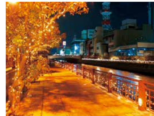
水辺のライトアップ