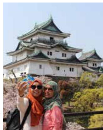
キャッシュレス決済の導入など、外国人観光客の利便性の向上