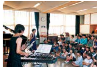
コミュニティ・スクール(※)での保護者や 地域の方によるマリンバ演奏会 ※保護者や地域の方を委員とする学校運営 協議会を設置した学校