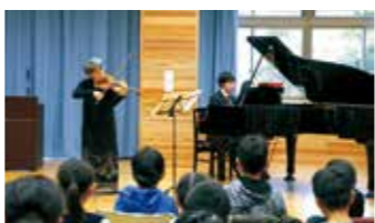
文化芸術活動の推進