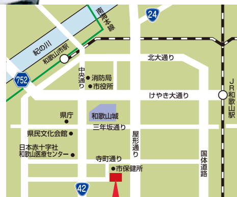
夜間・休日応急診療センター