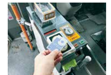
バス車載器(イメージ)