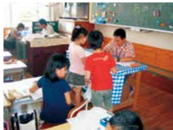
放課後学習等フォローアップ