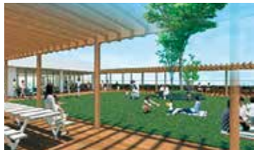
新市民図書館 屋上広場