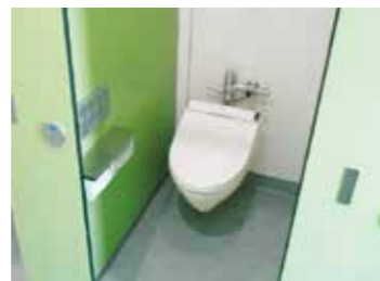
学校トイレの洋式化