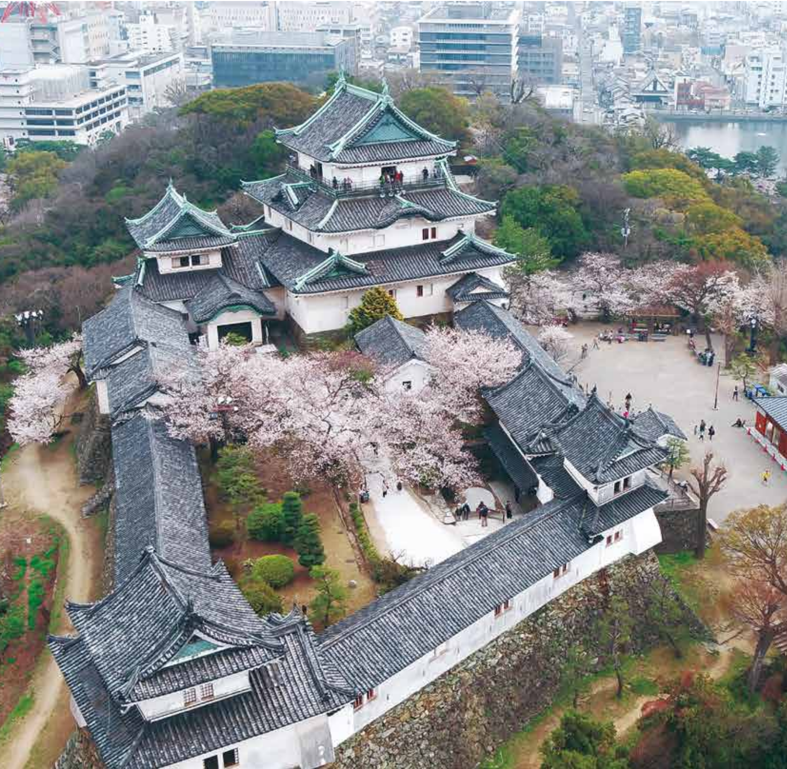
和歌山城公園（平成 30 年 3 月撮影）

Wakayama City Public Relations No.889 Apr 2019