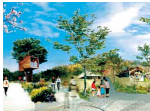
四季の郷公園で、農産物直売所やレストランなどを配置した道の駅の整備をめざす