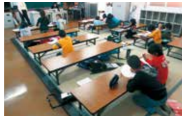
若竹学級（学童保育）