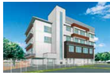
こども総合支援センターの拡充など 子供を虐待から守る取組を強化