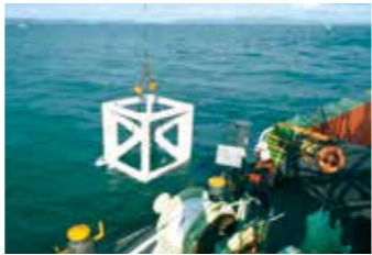
漁場の生産力向上(魚礁の設置)