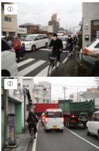
要望区間の通学状況（和歌浦交差点）

この歩道整備が進められることにより、通学児童をはじめ、利用者の安全が確保されるとともに、渋滞解消など快適な通行が確保されるようになります。