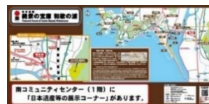
設置する案内看板のイメージ