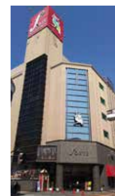
フォルテワジマ6階