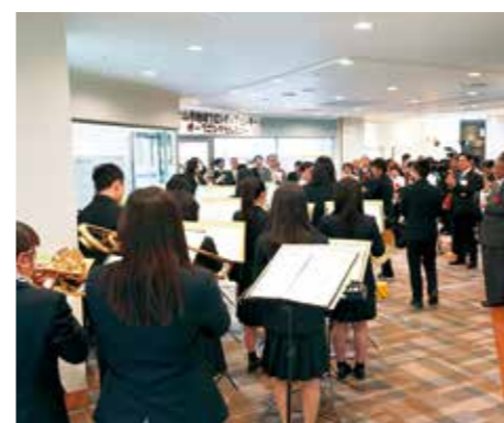
市立和歌山高校の吹奏楽部のみなさんによる音楽演奏がオープニングを盛り上げてくれました。

平成31年4月には本町小学校跡地に和歌山信愛大学が開学し、昨年4月に開学した東京医療保健大学和歌山看護学部とともにまちなかに学生さんの姿が増えています。これまで中心市街地の活性化に取り組んでこられた和歌山大学のみならずをはじめ、NPOや地域で活動される方々、またリノベーションなどでまちづくりに関わってきた方々、新たにまちなかで学ぶ学生さんなど、いろいろな人たちがつながる場所です。 地域フロンティアセンターにはチームフロンティア（自治振興課職員）がいます。チームフロンティアは、地域フロンティアセンターを飛び出し、学生さんとうながりたい地域の方々、そして地域で活動したい学生さんの声を拾い、相互交流を図っていきます。 また、この地域フロンティアセンターにはフリースペースを設けています。いろんな世代、所属の方々が交わるスペースとして、赤ちゃんをお散歩途中のお母さん、放課後や長期休暇を友達と過ごす小学生など、基本はどなたでもご利用いただけます。異なる立場の方と出会うことで新しいつながりができ、皆さんの活動の幅が広がることを願っています。 地域フロンティアセンターは、そんな皆さんとともに歩み、地域の活性化を目指していきます。