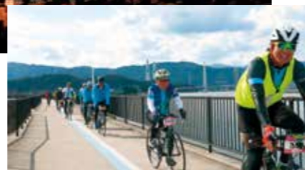
参加した人たちは爽やかな笑顔でサイクリングロードを駆け抜けていきました。