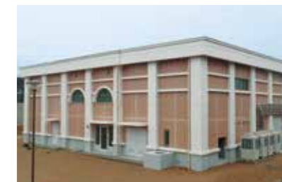
平成31年3月に稼働開始した真砂配水場