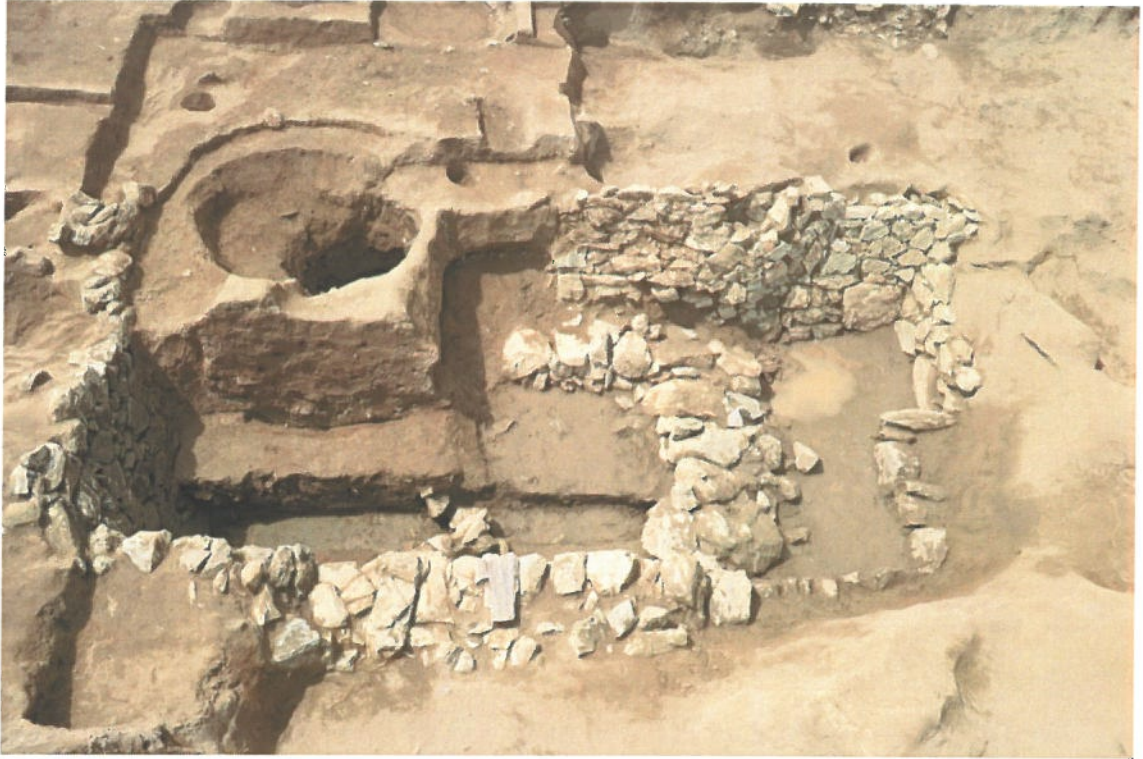
みつかった石組み枡