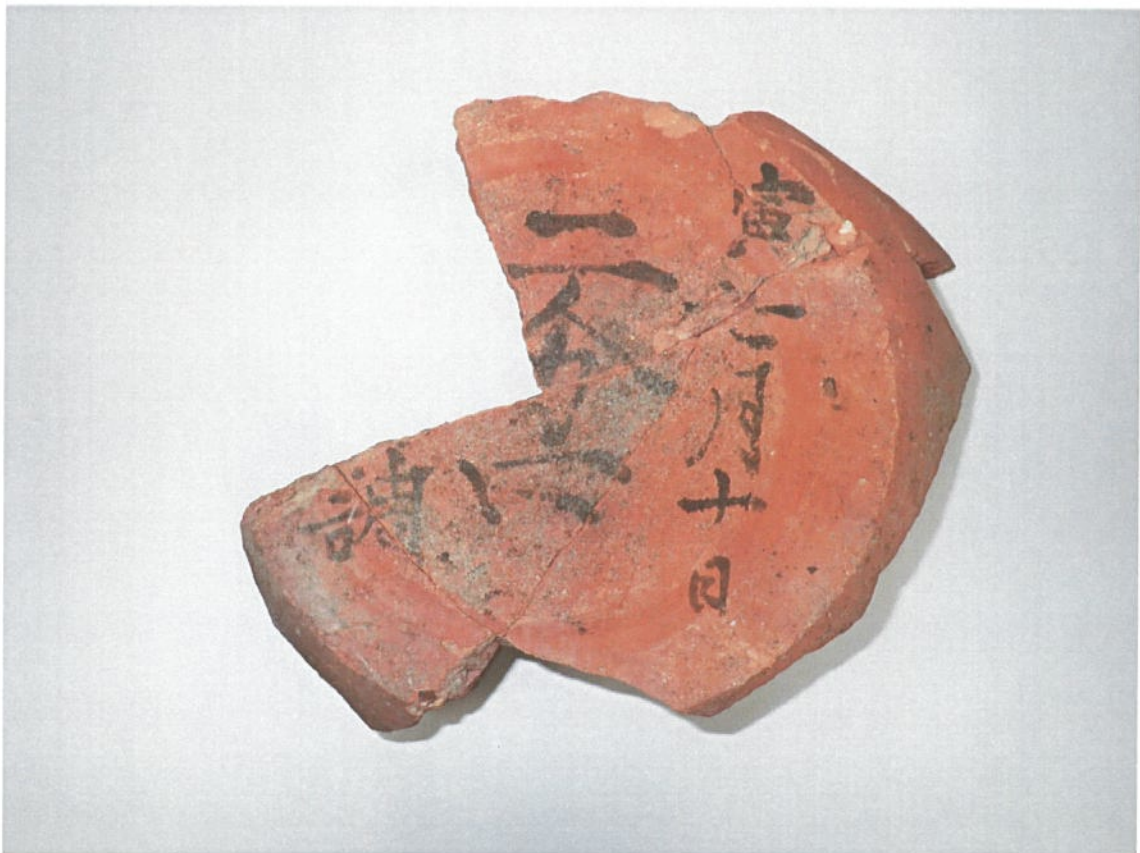
みつかった「二分口」の墨書のある土器