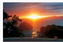
展望広場からの夕日

市内でも有数の夕日展望の名所として知られる雑賀崎灯台に、夕日を気軽に眺められる展望広場がオープンしました。記念して行われたセレモニーには、尾花市長や市議会議員、そして多くの市民の方が参加し、きれいな夕日と一緒に眺めました。