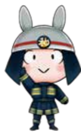
消防局マスコットキャラクター

空気が乾燥し、火災が発生しやすい季節です。また、寒くなり火を取り扱う機会も増えます。 火災予防に対する意識を高め、火災の発生を未然に防ぎましょう。住宅火災を未然に防ぎ、「もしもの時」に被害を最小限にするため、次のことを心掛けてください。