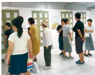
作品展示会 (8月7日~13日)

市民憲章硬筆競争書会 本市では、広く市民の皆様が市民憲章を認識し、実践していただくための啓発活動の一環として、毎年市内の小・中学生を対象に市民憲章硬筆競争書会を行っています。 本年度、小学生については53回目、中学生については50回目となっています。