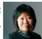
紀州徳川家19代当主 徳川宜子氏

●内容/ご挨拶、献上料理(徳川御膳)のご試食など。当日、アンケートにお答えの方に日清 麺NIPPON「和歌山特濃豚骨しょうゆ」をプレゼント!また、抽選で「フェスタ・ルーチェ」チケットや和歌山名産品など、素敵なプレゼントも!!