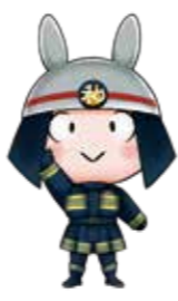
消防局マスコットキャラクター 和びと

火災予防に対する意識を高め、火災の発生を未然に防ぎましょう。住宅火災を未然に防ぎ、「もしもの時」に被害を最小限にするため、次のことを心掛けてください。