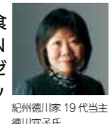
紀州徳川家19代当主 徳川宜子氏