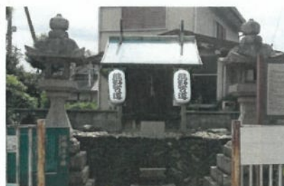
王子社跡の提灯(イメージ)