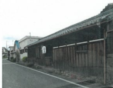
民家の提灯(イメージ)

申込先 和歌山市立博物館「史跡散歩」係 メール hakubutsukan@city.wakayama.lg.jp