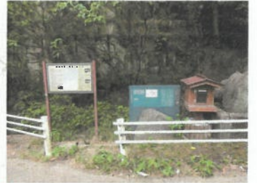
山口王子社跡 (※名称は「山口王子」)