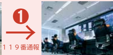
和歌山広域消防指令センター

ド クターカーとは、医師、看護師が乗車する救急車のことです。心肺停止や脳出血など、緊急度・重症度の高い症例が疑われる際に出動します。車内には、薬剤や人工呼吸器などの器材を積載しています。現場到着後すぐに診察が開始され、病院への搬送中に医療が行われるため、救命率の向上や後遺症の低減が期待できます。 本 市のドクターカーの沿革 平成26年6月から、平日9時～17時30分までの間、日本赤十字社和歌山医療センターと共同で、ドクターカーの運用を開始しました。平成29年1月からは、県内初となる365日24時間体制に変更し、同センター内に「常設型和歌山市救急ワークステーション」を設置しました。 また、応急処置がより十分に行えるよう、広い車内空間の確保と高度な処置が行える資器材を積載した高規格救急車を配置し、救急隊をローテーション方式により派遣しています。高規格救急車を配置したことにより、資器材などの保管場所について医師等との共通認識が高まります。そのため、現場活動がスムーズになり、より早期から医療行為が行えるようになりました。