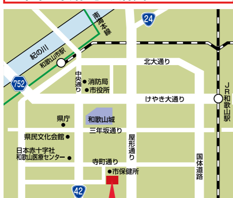
夜間・休日応急診療センター