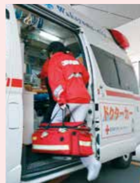
ドクターカー出動のながれ

指令センターからドクターカー要請があった場合は、医師・看護師同乗の上、救急現場に出動します。出動以外の場合は、救急搬送された傷病者への医師による診察や処置、看護師のケア補助などを実施しています。救急隊が疑った病態と医師の診察結果を照らし合わせ、疑問点があれば医師に質問し、常に救急医療の知識を習得しようと心掛けています。また、過去の救急活動を振り返り、改善点を検討するため救急症例検討会を定期的に実施しています。