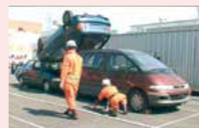
救急現場（イメージ）