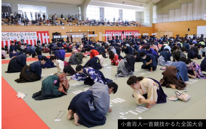
小倉百人一首競技かるた全国大会