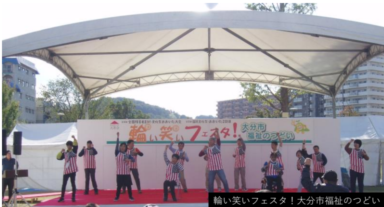
(参考) 第18回全国障害者芸術・文化祭おおいだ大会