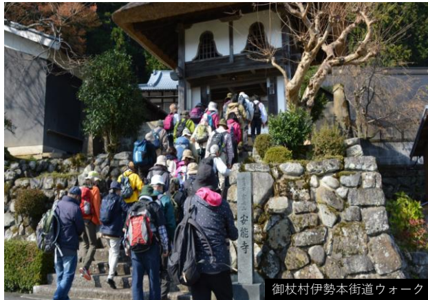
(参考) 第32回国民文化祭・なら2017