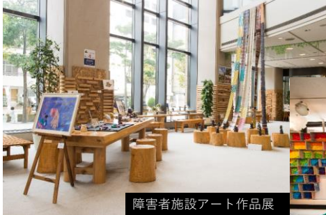
障害者施設アート作品展