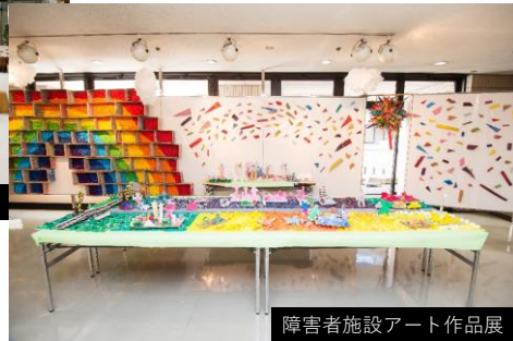
障害者施設アート作品展