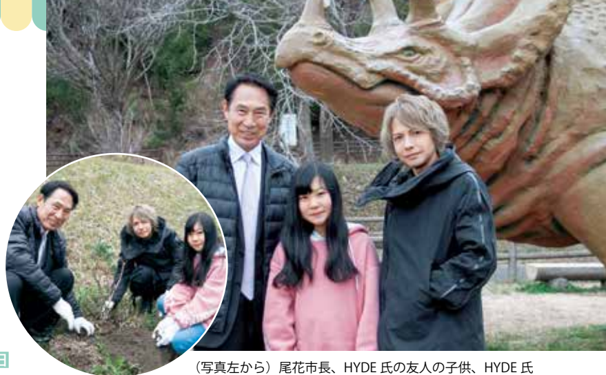
(写真左から) 尾花市長、HYDE 氏の友人の子供、HYDE 氏