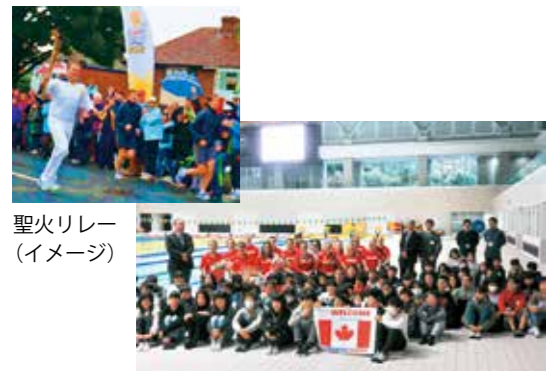
聖火リレー (イメージ)