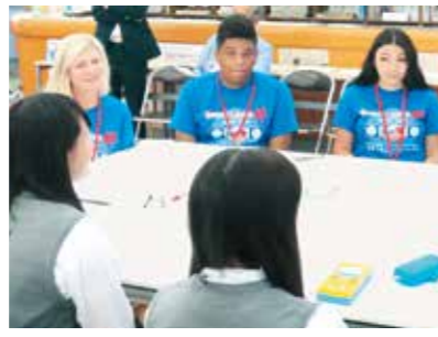
姉妹都市・友好都市との交流・連携の強化