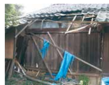
老朽化した空き家の除却を促進

A3 3月9日、政府は「マスクチーム」を創設し、都道府県や民間業者も連携して、3月には「月産6億枚程度」の供給を確保するとしています。しかし、店頭に行き渡るには一定の期間を要すると予想されます。もし、マスクがない場合はハンカチやタオルなどを塞ぐことができるもので代用し、飛沫を防いでください。