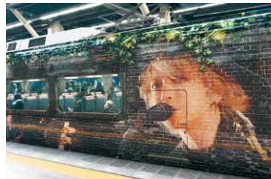
和歌山市ふるさと観光大使 HYDE 氏と南海電鉄がコラボした「HYDE サザン」