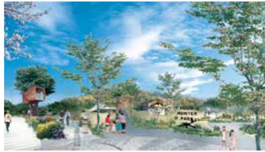
四季の郷公園味覚ゾーン (イメージ)