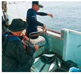
漁村での生活体験や、研修等を実施