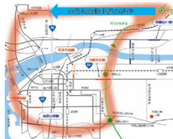
和歌山高速環状道路の実現に向けた取組(イメージ)