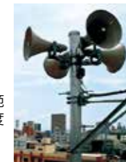
防災行政無線の可聴範囲を拡大(令和2年度末で、新設と更新の204基が完了予定)