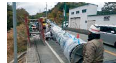
老朽化した配水管の更新・耐震化等を強化