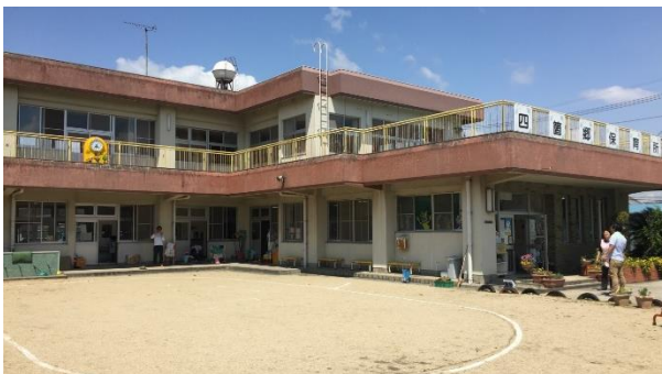
旧四箇郷保育所の現況写真