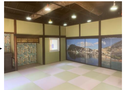
大人数が集まれる大広間