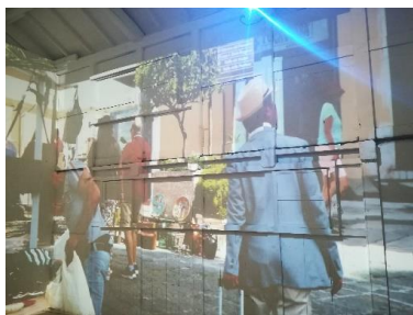
アマルフィコーナー