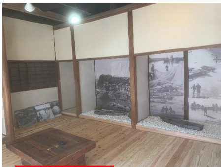
地域交流スペース