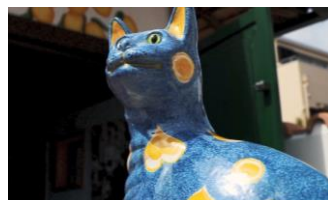
アマルフィで購入した青い猫の置物