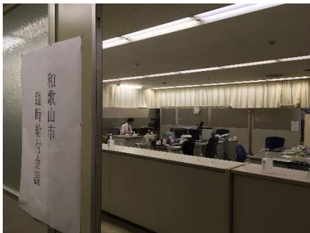
4月24日臨時給付金課を設置