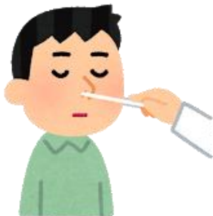
人口10万人当たりのPCR検査数の累計