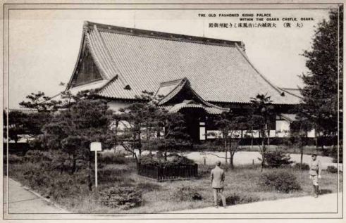
大阪城に移築された二の丸御殿大広間(紀州御殿) 個人蔵