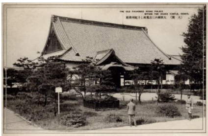
絵葉書 大阪城に移築された二の丸御殿 大広間（紀州御殿）

和歌山城の内外には、紀州徳川家が政治を執り、生活した御殿がいくつも存在しました。本展では、それらの御殿について紹介します。