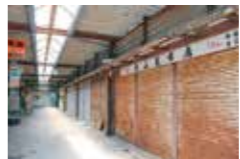
老朽化した旧関連商品売場棟

店舗や曜日によって異なりますが、営業開始は市場が動き始める時間に合わせ、夜中の2時から。飲食店街は14時ごろまで営業していますが、専門店街は朝の7時ごろに閉店します。まるごと楽しむためには、早起きがおおすすめです。