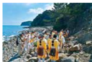
友ヶ島(沖ノ島)の関加井跡