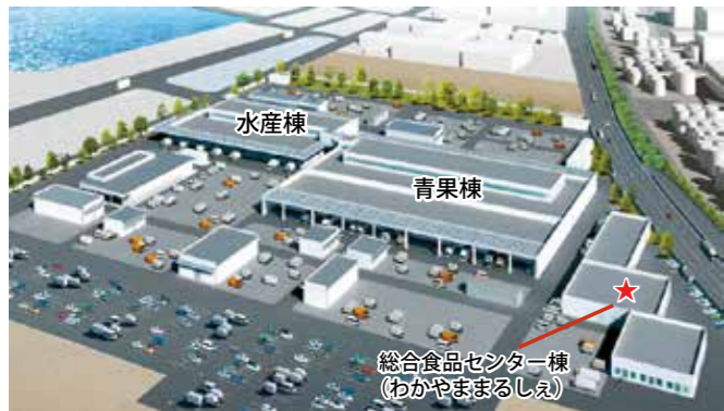
中央卸売市場整備イメージ