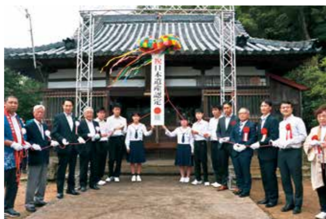
加太の阿字ヶ峰行者堂で地域の方々と認定記念式を行いました。