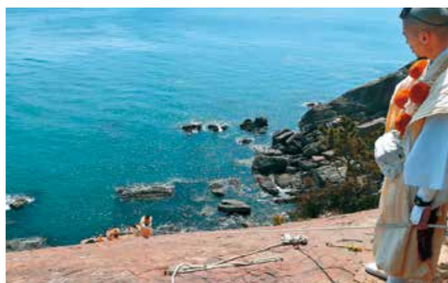
友ヶ島(虎島)の岸壁修行