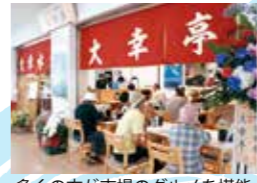
多くの方が市場のグルメを堪能

飲食店街と専門店街からなり、飲食店街には新鮮な食材を使った海鮮丼や天ぷら、カフェ、お肉、お弁当などが味わえる店が12店舗入っています。専門店街には豆腐や鯉節、干物、漬物、乾物、総菜などが購入できる店が25店舗あります。飲食店街と専門店街を合わせて37店が軒を連ね、和歌山の食と市場の雰囲気がどちらも味わえます。