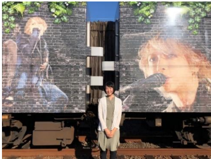
「HYDE サザン」撮影会イメージ