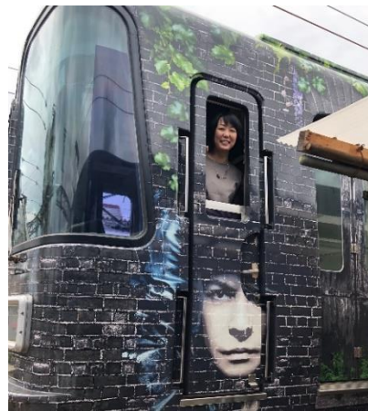
「HYDE サザン」撮影会イメージ