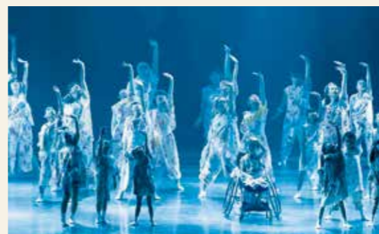
「第33回国民文化祭・おおいた2018」開会式・オープニングより

各ジャンルの文化活動を全国規模で発表、共演し、交流する日本最大の文化の祭典です。1986年に東京で開催されて以来、毎年開催を希望する都道府県のうちから選ばれた自治体において開催されています。2021年に開催される国民文化祭は36回目となります。