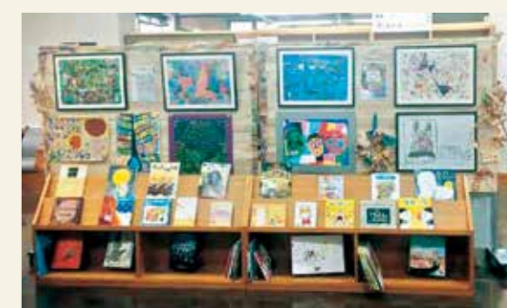
「第18回全国障害者芸術・文化祭おおいた大会」の「日田杉×まちなかアート」より

障害者の芸術及び文化活動を通して、障害のある人もない人もともに参加し、交流の輪を広げる文化祭です。2001年から開催されています。2017年より国民文化祭と一緒に開催することになりました。2021年に開催される全国障害者芸術・文化祭は21回目となります。