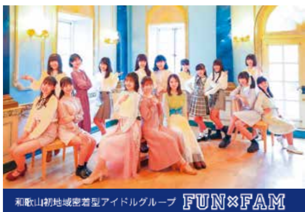
和歌山初地域密着型アイドルグループ FUN×FAM

11月9日 10時~11月15日 10時~13時(雨天中止)に実施する「秋の火災予防運動」に先立ち、防火イベント「秋の火災予防運動スタートキャンペーン」を開催します!