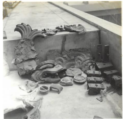
古写真 被災した和歌山城天守閣残片 【和歌山城整備企画課蔵】