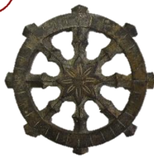
伝和歌山城天守台出土地鎮具 輪宝・楸【和歌山市立博物館蔵】