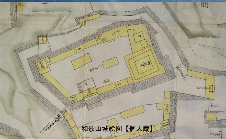
和歌山城絵図【個人蔵】