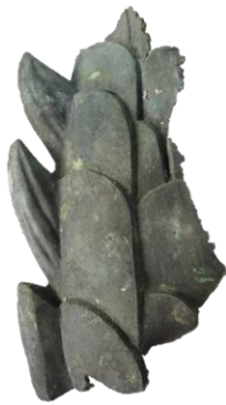
伝和歌山城天守閣鯨腹断片 【和歌山市立博物館蔵】