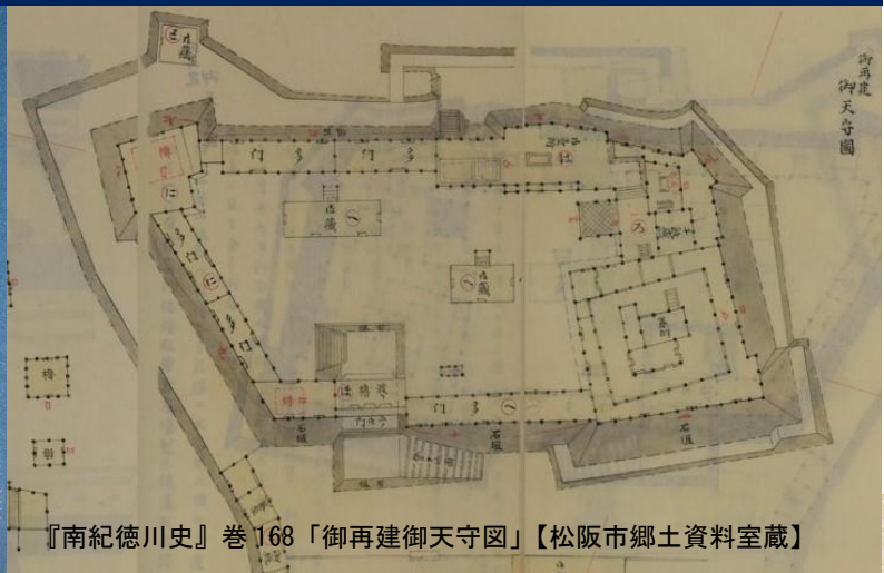
『南紀徳川史』巻168「御再建御天守図」