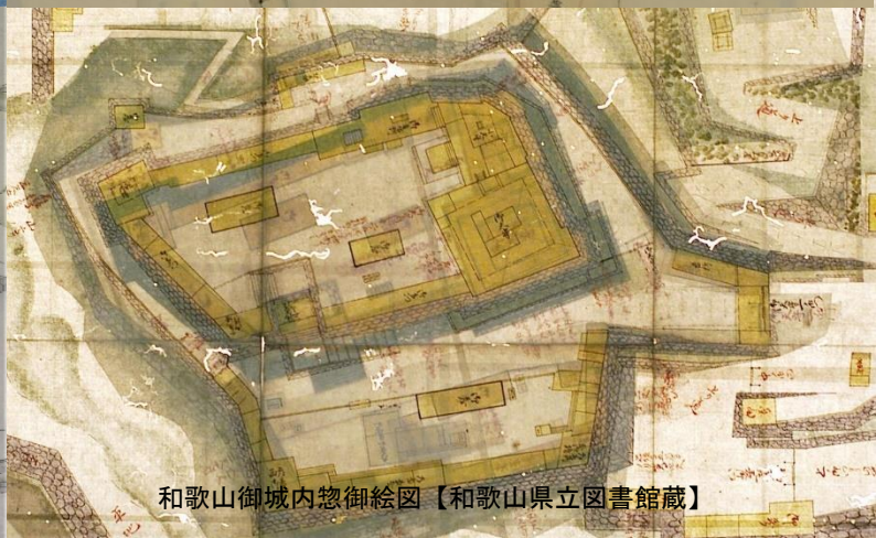
和歌山御城内惣御絵図【和歌山県立図書館蔵】