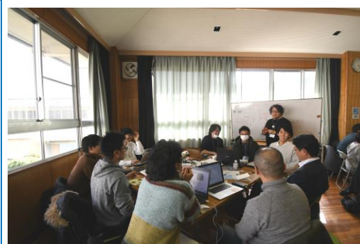
昨年度開催の 「リノベーションスクール@加太」の様子

同スクールでは、参加者が「ユニット」と呼ばれるチームを組み、実際の遊休不動産を対象に、リノベーションまちづくりの先駆者によるレクチャーやアドバイスを受けながらリノベーション事業計画を作成します。最終日には、所有者に対して公開プレゼンテーションで提案を行います。同スクール終了後には、提案内容のブラッシュアップを重ね、事業化を目指していきます。