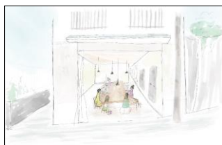
「シェアハウス with おせっかい食堂」