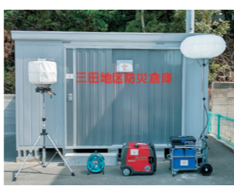
●問合せ/地域安全課 ☎435-1005