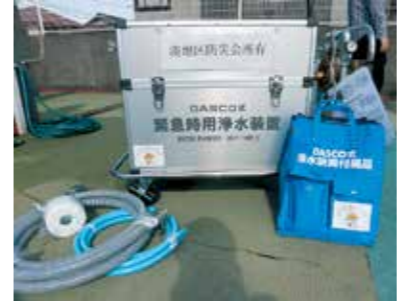
湊地区防災会が整備した緊急時浄水装置

湊地区防災会に、緊急時浄水装置が整備されました。 ▼ 問合せ 地域安全課 ☎ 435・1005