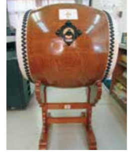
和佐地区連合自治会が購入した和太鼓

宝くじの社会貢献広報事業として、宝くじの受託事業収入を財源として実施しているコミュニティ助成事業による助成を様々なことに活用しています。 ● 一般コミュニティ助成事業 和佐地区連合自治会が、和太鼓他備品を購入しました。地区内の諸行事に利用します。 ▼ 問合せ 自治振興課 ☎ 435・1011