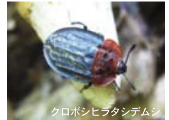
クロボシヒラタシテムシ