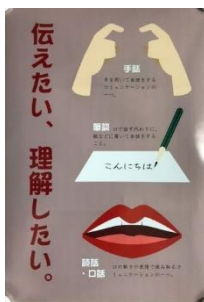
市長賞作品 川端 教恩さん(18)