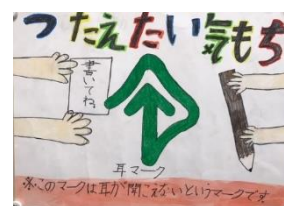
優秀賞作品（中学生以下の部） 土佐 舞波美さん(8)