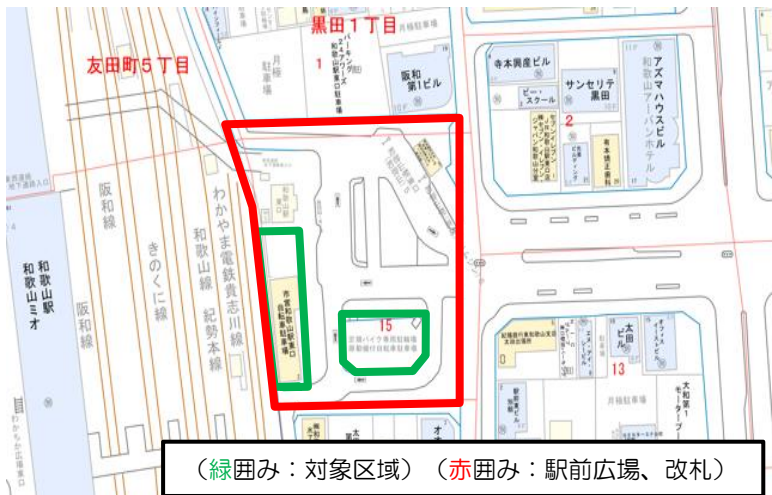
(緑囲み：対象区域) (赤囲み：駅前広場、改札)