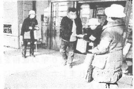
年末一斉街頭啓発活動表 (地区名・啓発日 活動場所等)