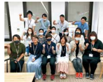
▲現在40人以上が勤務していて、時短や週3日での勤務など様々な雇用形態で働ける会社です。 ※写真は2019年撮影

和歌山にはきれいな海があり、山もあり、温泉もあるという魅力的なコンテンツが揃っています。社員にとってより良い仕事環境を作っていくためにも、和歌山で独自のワーケーションをやりたいと思っています。