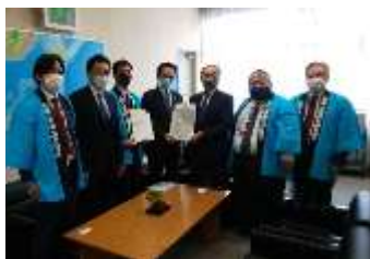
国土交通省 道路局長

■和歌山市と京奈和・第二阪和連絡道路建設促進和歌山市議会議員連盟との合同要望（令和2年10月6日）