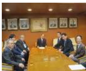
二階俊博 自由民主党幹事長