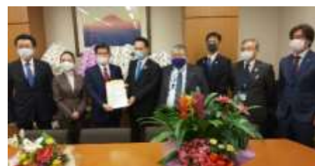
石井啓一 公明党幹事長