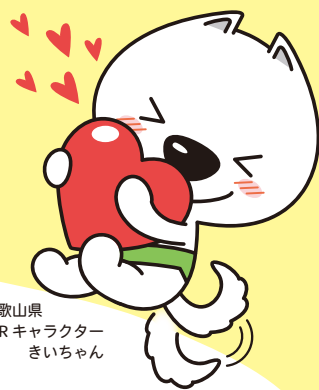
和歌山県 PRキャラクター きいちゃん