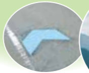
▲矢羽根型路面標示