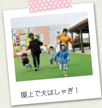
屋上で大はしゃぎ！