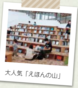
大人気「えほんの山」

週に2回くらい利用します。子供が遊ぶスペースやご飯を食べられる席があるし、買い物もできるので丸1日居られます。