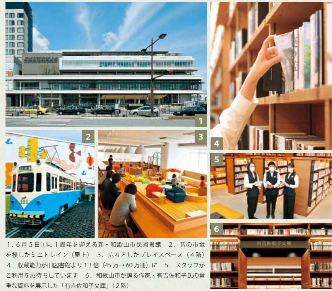
1. 6月5日国に1周年を迎える新・和歌山市民図書館 2. 昔の市電を模したミニトレイン（屋上） 3. 広々としたプレイスペース（4階） 4. 収蔵能力が旧図書館より1.3倍（45万→60万冊）に 5. スタッフがご利用をお待ちしています 6. 和歌山市が誇る作家・有吉佐和子氏の貴重な資料を展示した「有吉佐和子文庫」（2階）

令和2年6月5日にグランドオープンした「新・和歌山市民図書館」。今回は、様々な用途で図書館を利用する方の声を通じて、新しい市民図書館の魅力に迫ります。 和歌山市民図書館 ☎432-0010