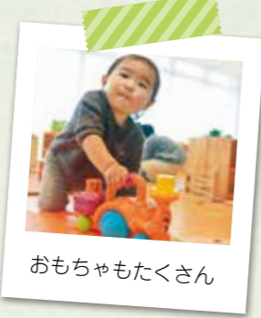
おもちゃもたくさん

◀図書館4階にある地域子育て支援拠点施設「育ちのえき くすの木」では、未就園児の親同士の交流や、子育てに関する相談、一時預かりなどの育児サポートを行っています。