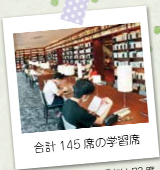
合計 145 席の学習席