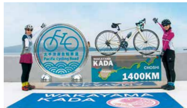
記念モニュメントでは、自分の自転車を載せて記念撮影ができます。

千葉県銚子市から神奈川、静岡、愛知、三重、そして加太に至る1,487kmの太平洋岸自転車道が、世界に誇るサイクリングルートとしてナショナルサイクルルートに指定されました。ルートには、世界遺産の富士山をはじめ日本を代表する景勝地や観光地が多数あります。市内のルートは和歌山マリーナシティから和歌浦、雑賀崎など海岸沿いを通り加太まで続く約30kmで、終着地・加太には記念モニュメントがあります。この機会にサイクリングの旅を始めてみませんか。