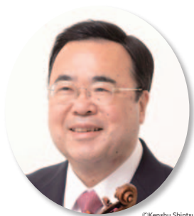
東京藝術大学 澤 和樹 学長

長崎市出身。シンガー・ソングライター、小説家。'73年フォークデュオ・グレイプとしてデビュー。'76年ソロ・シンガーとして活動を開始。「関白宣言」「北の国から」など数々のヒット曲を生み出す。小説家としても「解夏」「風に立つライオン」などを発表。多くの作品が映画化、テレビドラマ化されている。またNHK「今夜も生でさだまさし」のパーソナリティとしても人気を博している。2015年8月、一般財団法人 風に立つライオン基金を設立（2017年7月、公益法人として認定）。様々な助成事業や被災地支援事業、感染防止対策の人的支援を行なっている。現在、最新セルフカバーアルバム「さだ井～新自分風土記Ⅲ～」を引っ提げて全国ツアーを開催中。今秋には前人未到の通算4,500回を超える予定。